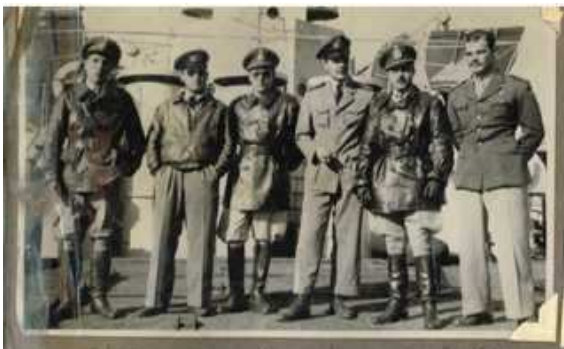
El personal de la 45ª División de Infantería y el personal de la 1ª División de Infantería en el Puerto de Cherbourg -