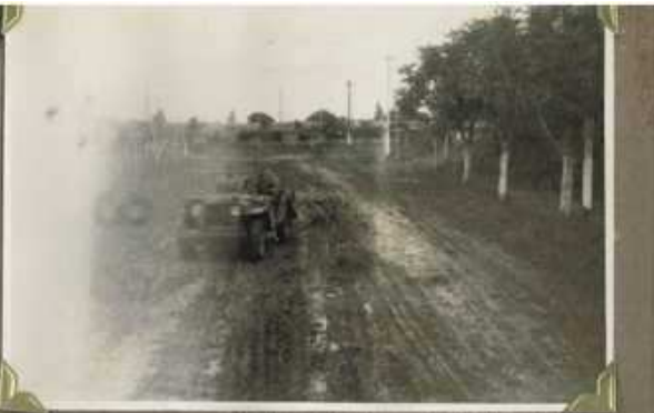
Operación de la 1ª Brigada de Infantería