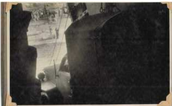
Un Sherman en el río