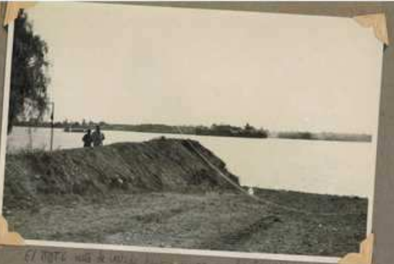
El puente de madera sobre el río de la ciudad de Lima