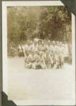
Ex (Quinta) con los oficiales