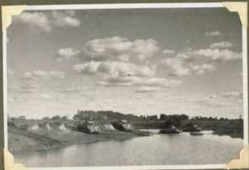
El primer tanque en el río