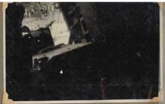
Un Sherman en el río