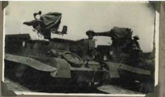
El 11 de Mayo de 1943