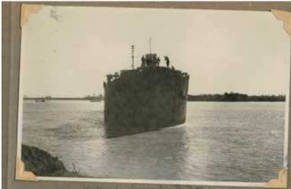
Vista de frente del B.P.T. 6