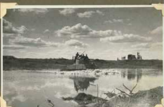
El primer tanque en el río