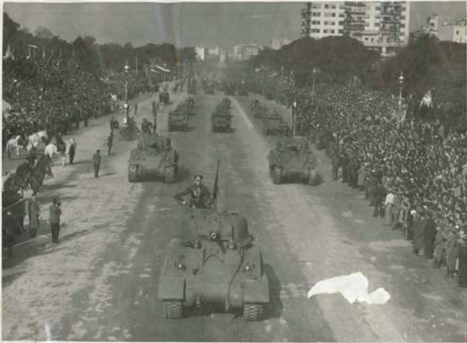
A la frente Gen. Sanchez Bayona // 1. Trova Izq. The 8. Panzer Army