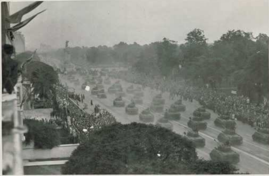
Vista en conjunto de la Aproximación Tenques