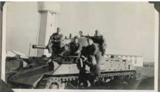
El 11 de Mayo de 1943 Soldados de la 1ª Brigada de Infantería en el Campamento