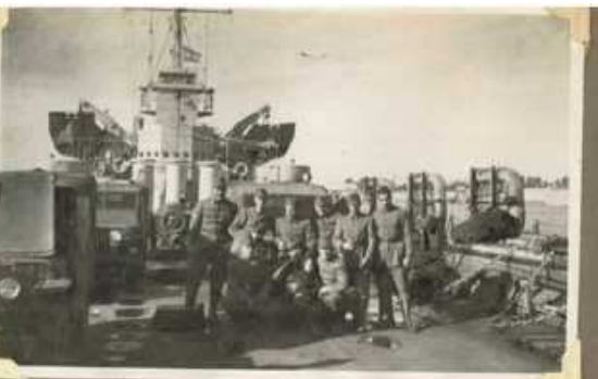
El personal de la 45ª División de Infantería.