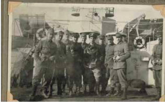
La recepción de la 45ª División de Infantería en Normandía -