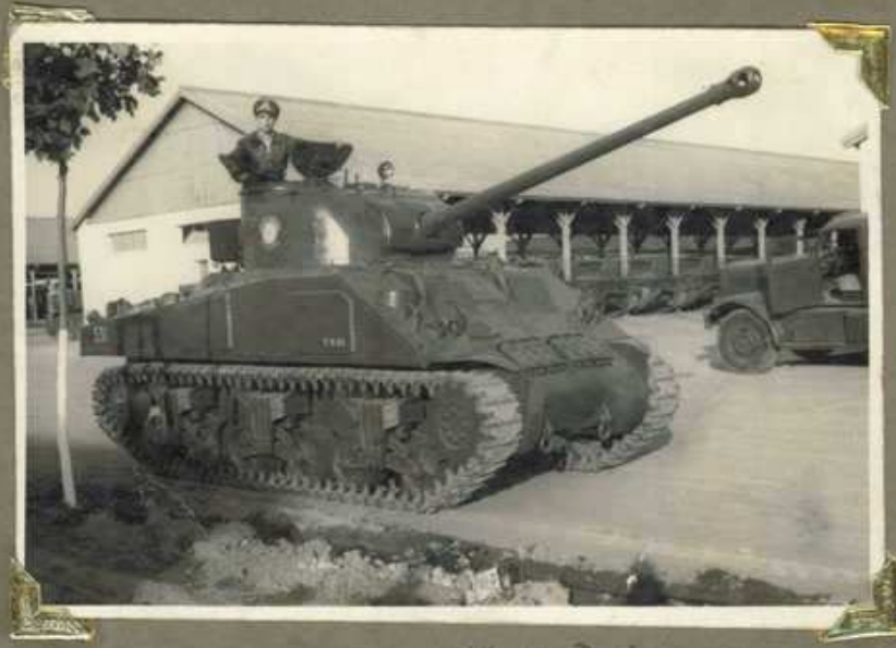
The 1 o B. Perez Aquino