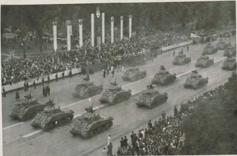
1. 42 Co. Tanks