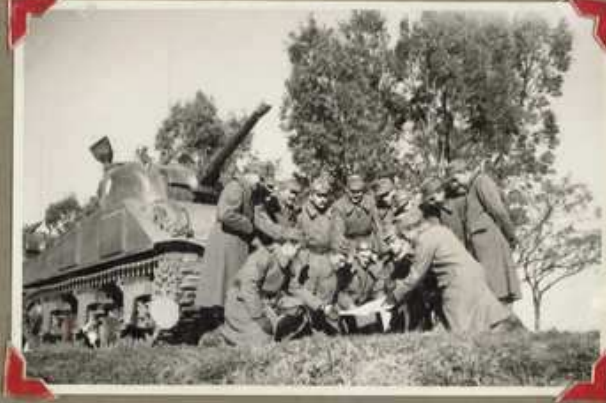
The 8. Panzer Army