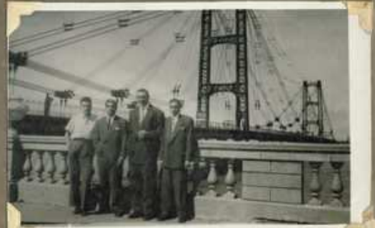
Marzo de 1944. Restos de la Jeca. Mayo de 1942