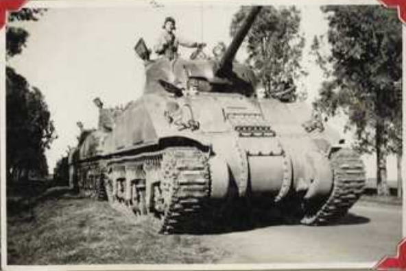
17 de Octubre de 1950