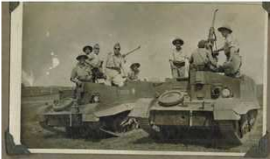
Los comandantes de la 1ª Brigada de Infantería El 11 de Mayo de 1943