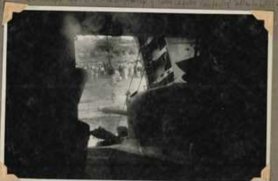
El puente de madera sobre el río de la ciudad de Lima