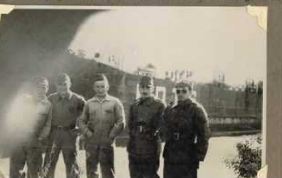
El personal de la 45ª División de Infantería y el personal de la 1ª División de Infantería.