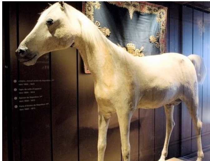
Vizir el caballo embalsamado de Napoleón, en Los Inválidos

Muchos años después, durante la restauración del Imperio y con Napoleón III como Emperador de Francia, en 1868 fue donado al Museo del Louvre de París. No obstante nunca fue expuesto en ese lugar y permaneció olvidado en los almacenes del Louvre hasta 1905, año en que Le Vizir fue donado al Museo del Ejército, ubicado en "Los Inválidos" en París y expuesto en una de sus salas.