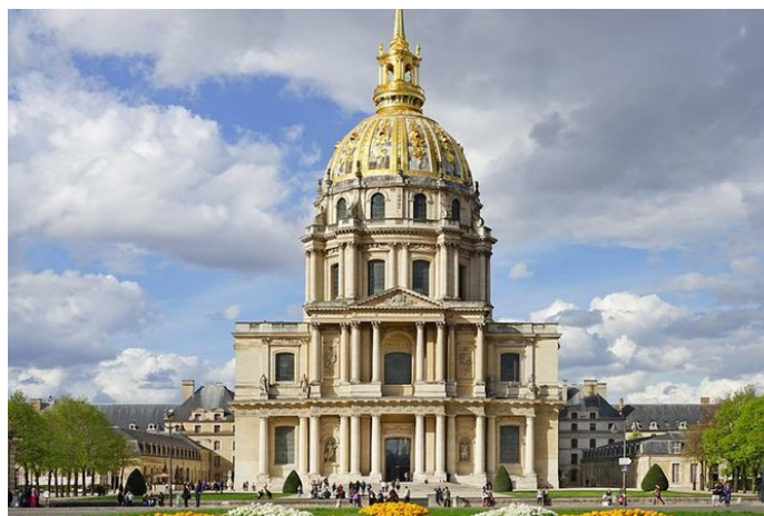
Tumba de Napoleón en Los Inválidos donde se encuentra el caballo Vizir embalsamado